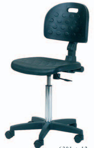
6301 + 12