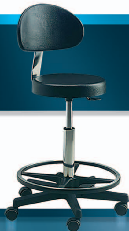
6001 + 11 + 15