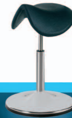
6501 + 16